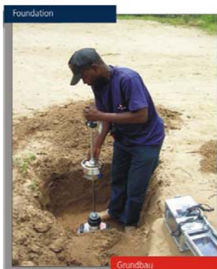
Foto 7: Cimentaciones