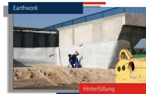
Foto6: Rellenos localizados