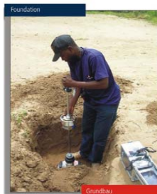
Foto 7: Cimentaciones